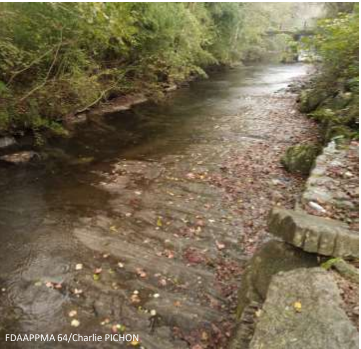
FDAAPPMA 64/Charlie PICHON