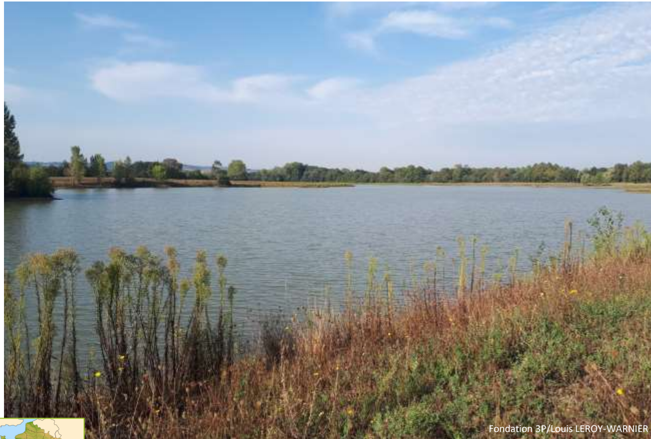
Fondation 3P/Louis LEROY-WARNIER