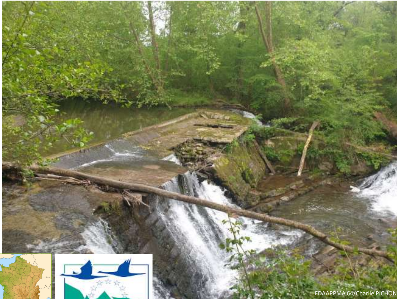
FDAAPPMA 64/Charlie PICHON