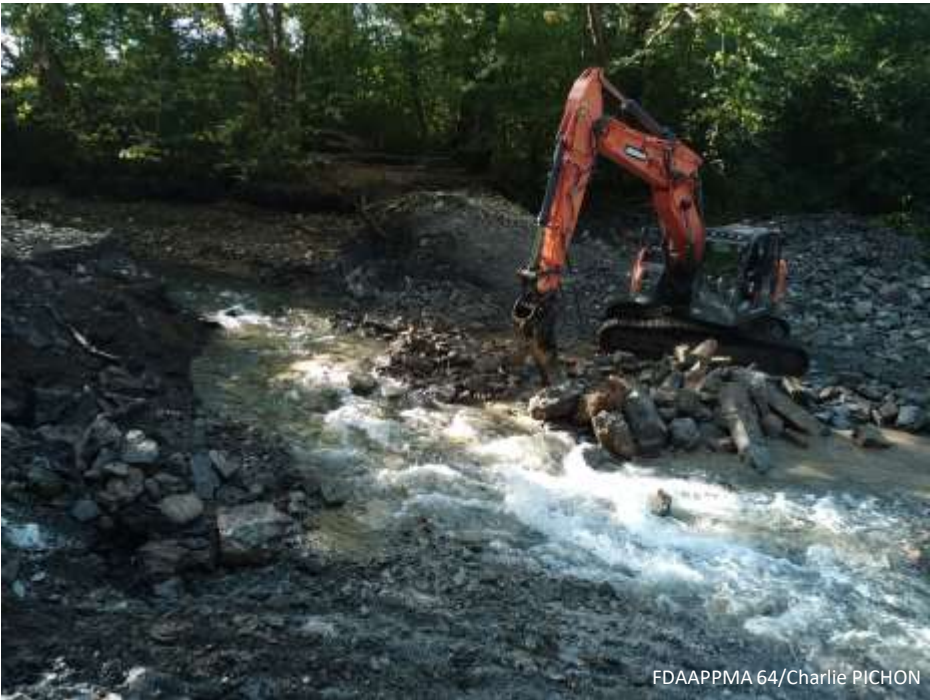
FDAAPPMA 64/Charlie PICHON