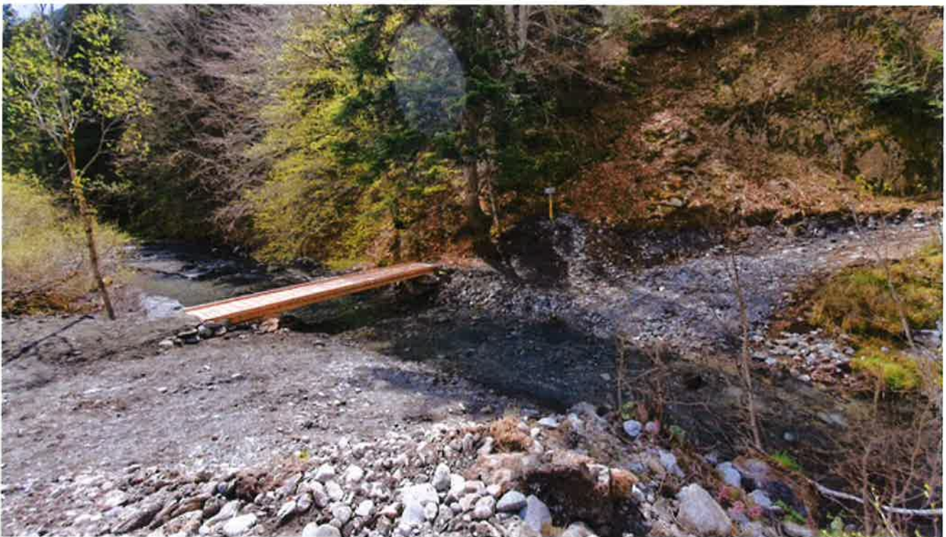
Installation d'une passerelle piétonne