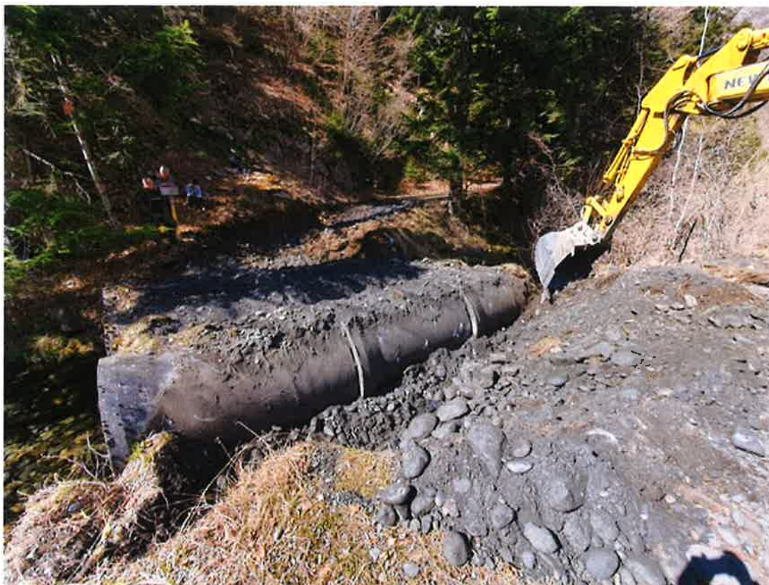
Enlèvement des matériaux