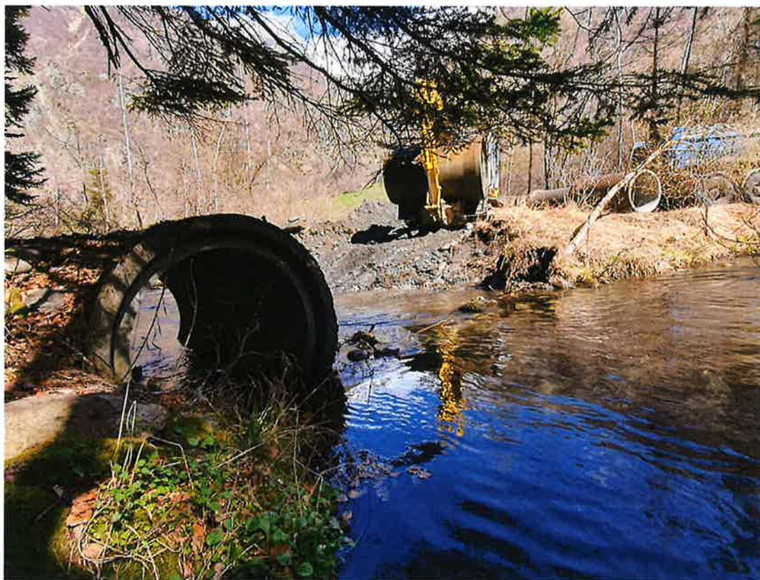
Dépose des buses