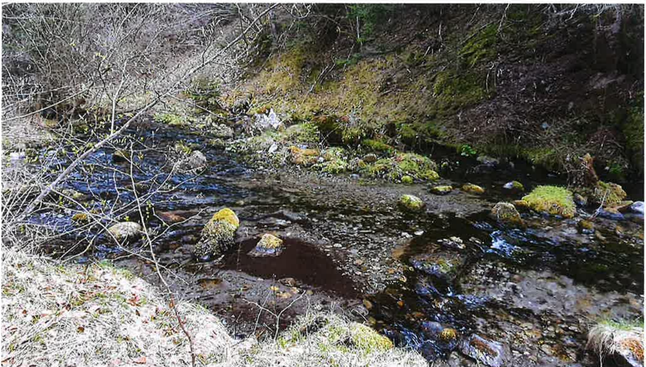
La partie amont de l'adoux est bien diversifié et propice au fraie de la Truite fario et à l'accueil du Chabot