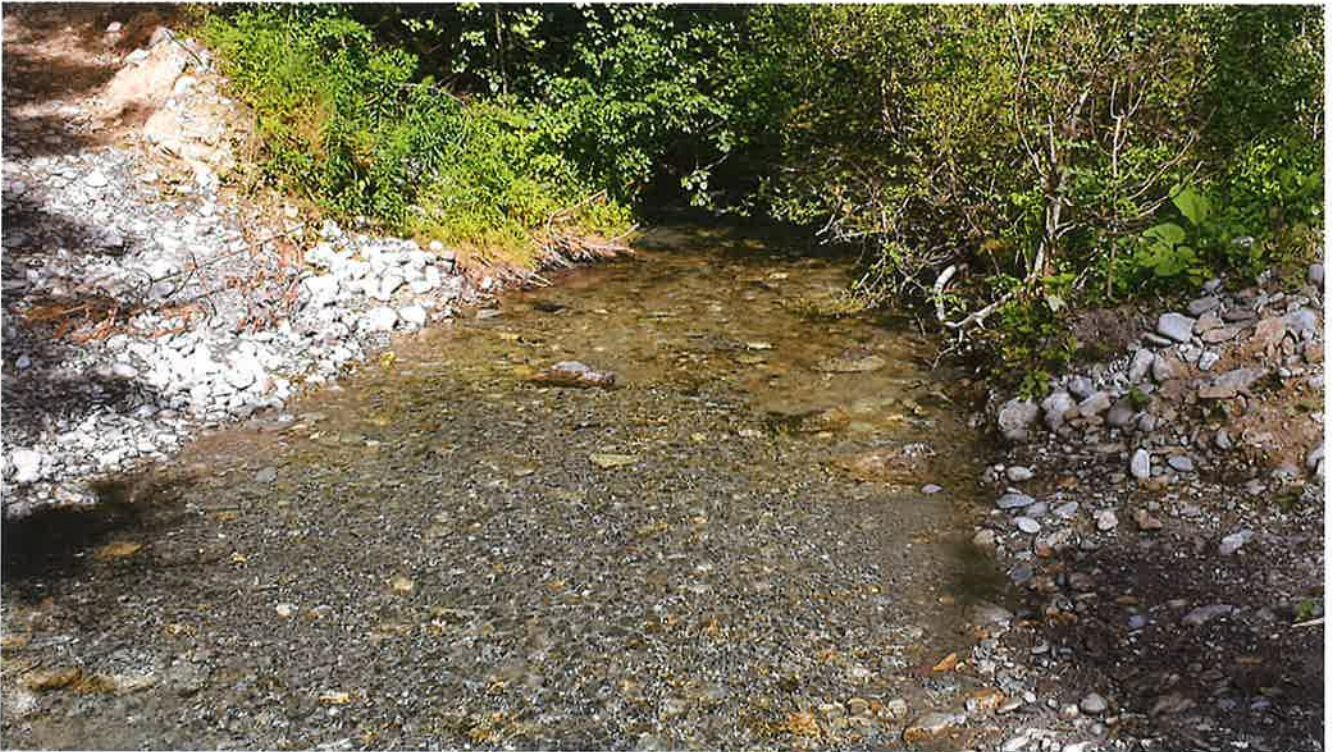
Restauration parfaite de la continuité écologique