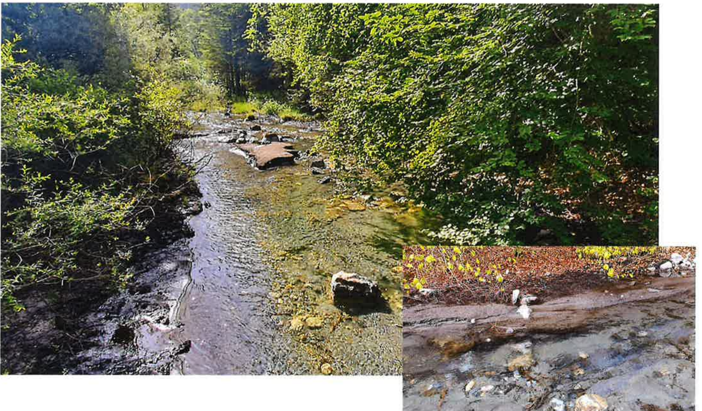
Diversification du courant, début du décolmatage du lit en amont Apparition de graviers