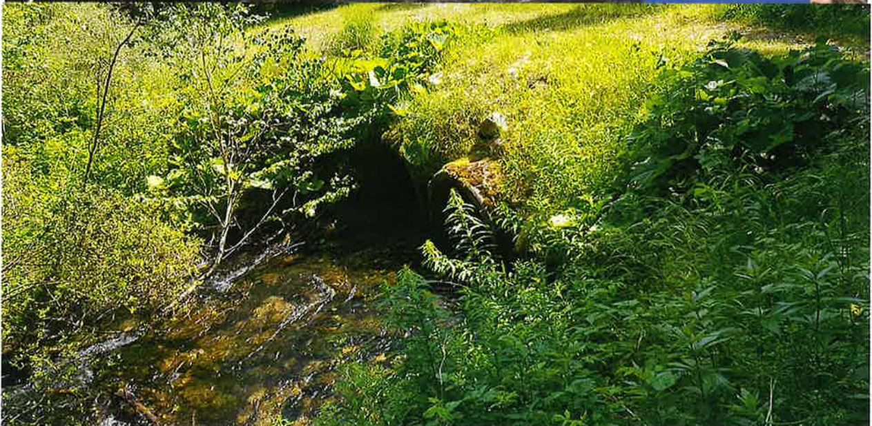
Gué busé installé sur l'adoux Obstacle à la continuité écologique et sédimentaire