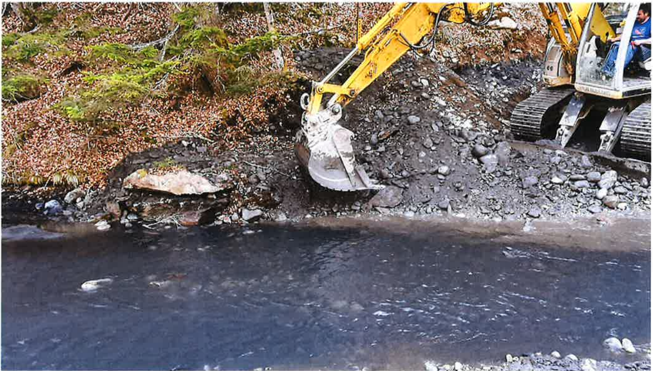
Restauration du profil des berges